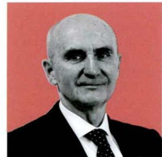
Pier Paolo Rosetti Direttore generale Conserve Italia

la catena. In quanto cooperativa agricola, vogliamo tutelare il reddito delle nostre aziende socie e proteggere la capacità di spesa del consumatore finale". In questa direzione si inserisce la risposta dell'azienda al caro-bollette. "Stiamo portando avanti - racconta Rosetti - un piano di investimenti da 86 milioni di euro che sarà concluso entro il 2026 con interventi mirati nei nostri stabilimenti produttivi per migliorare l'efficienza energetica degli impianti e aumentare il ricorso alle energie rinnovabili, potenziando così la nostra capacità di auto approvvigionamento energetico e riducendo l'impatto ambientale. Stiamo investendo in impianti di cogenerazione e fotovoltaico, oltre che in tecnologie all'avanguardia per i processi produttivi. Tutto questo per garantire la sostenibilità integrale della nostra filiera: in termini ambientali, questi interventi ci consentiranno di avere performance ancora più rispettose dell'ecosistema; in termini sociali, le iniziative